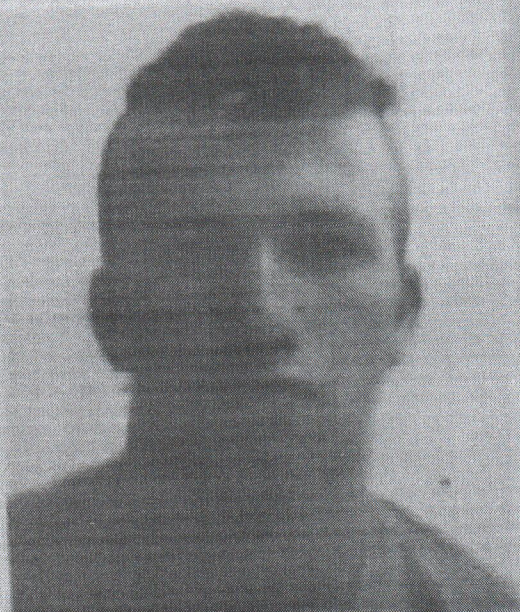
IMAGEM DO DITO