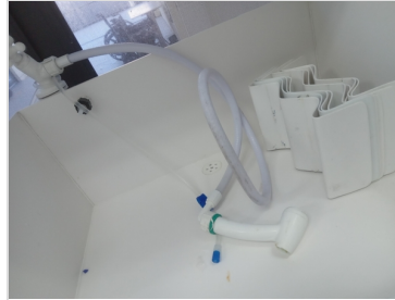
Troca da ducha do reuso