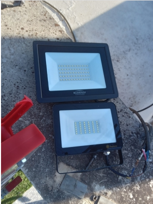
Troca do refletor