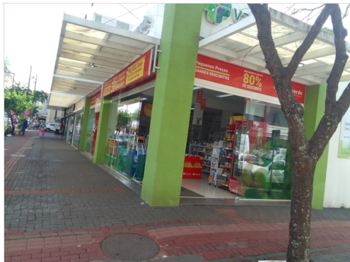
FOTO DA FACHADA

NOME DA FILIAL Vale verde av. rio branco Apucarana