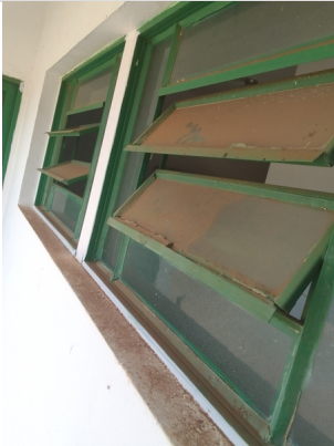
Vidro janela barro