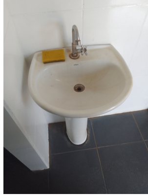
Pia não limpa