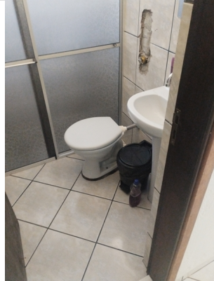
banheiro feminino administrativo