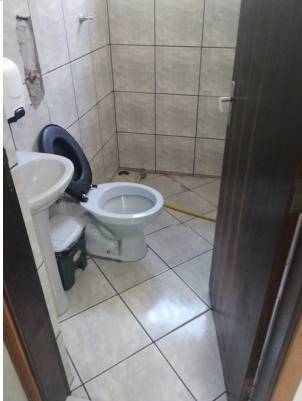
Banheiro masculino administrativo